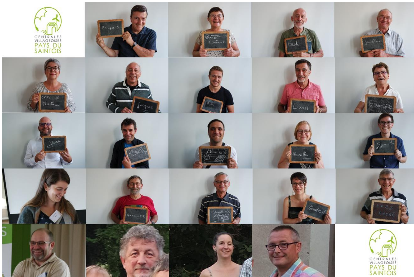
Trombinoscope d'une majorité des citoyens impliqués dans le projet qui se réunissent régulièrement.