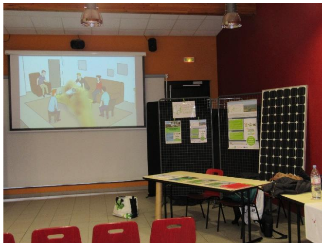
Stand du 23 septembre 2018