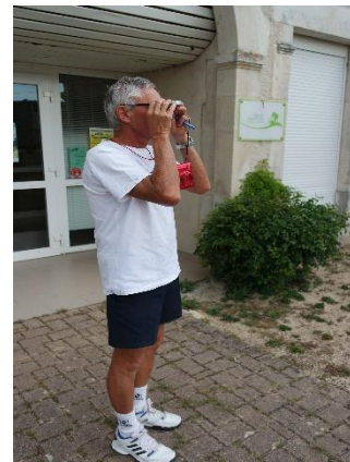
Outil pour vérifier l'orientation de la toiture.