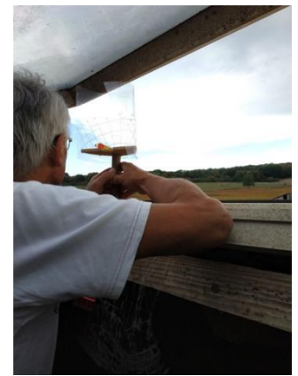
Vérification des ombres portées.