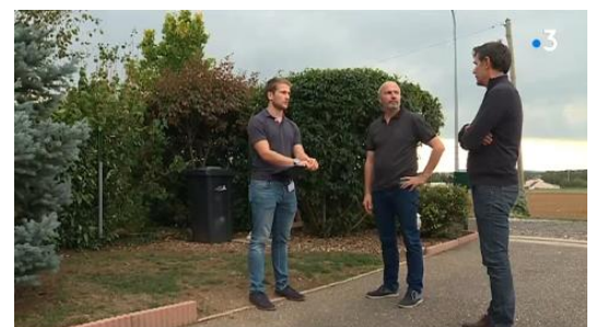
Reportage sur France 3 : « 3 min pour la planète ».

Si vous avez été attentif le chiffre de 140 vous dira quelque chose. C'est le nombre de personnes qui se sont déclarées intéressées par le projet en juillet 2018 (cf. édito). Nous sommes dorénavant 190 inscrits sur la liste des adresses électroniques. L'intérêt croissant que suscite notre projet est très encourageant. Nous vous en remercions et vous invitons à nous contacter pour recevoir notre bulletin d'information « Azimut Saintois » ou pour adhérer à l'association en complétant le formulaire d'inscription sur notre site.