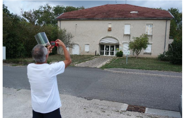
Visite d'une toiture à Vaudigny. Vérification visuelle extérieur (velux, prises d'air, antenne, cheminées, etc.).

Un premier périmètre de 16 toitures se précise. Le travail des bénévoles doit dorénavant être confirmé par un bureau d'étude qui établira un rapport permettant de définir un modèle économique garantissant la viabilité économique de la future société. La dernière actualité du groupe est d'ailleurs l'appel d'offre lancé auprès de bureaux d'études spécialisés en vue d'obtenir les devis correspondant aux prestations fixées dans un cahier des charges.